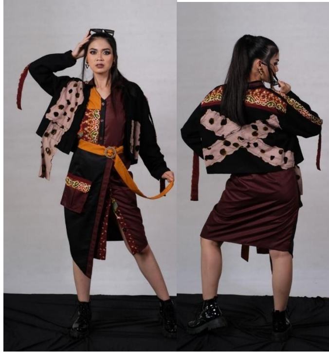
Gambar 2. Hasil Jadi Busana Depan Dan Belakang