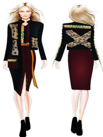
Gambar 1. Desain busana tampak depan dan belakang

Tujuan membuat desain adalah untuk membantu memberikan petunjuk dalam proses pembuatan busana. Penelitian ini yang pertama adalah membuat desain jaket dengan ukuran oversize menggunakan kerah sanghai dan menggunakan variasi tali pada bagian lengan. Berikut merupakan gambaran desain jaket dengan penerapan teknik burnt fabric .