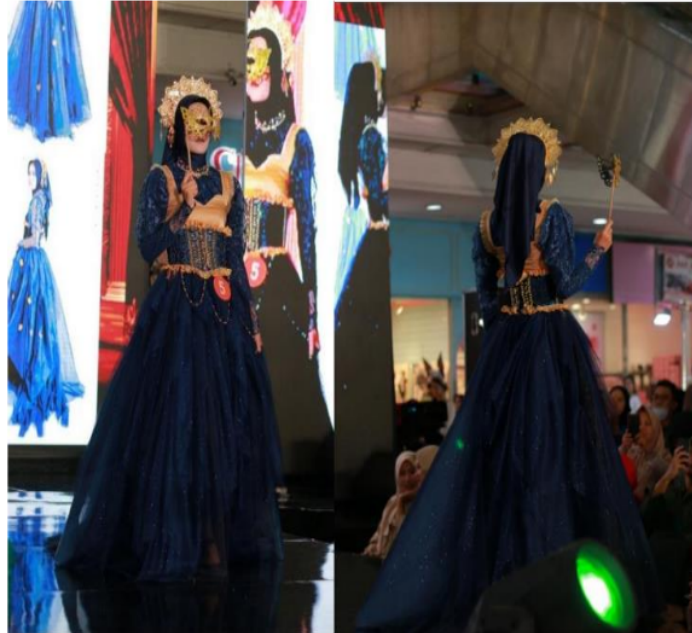
Gambar 3 Hasil akhir dari Busana