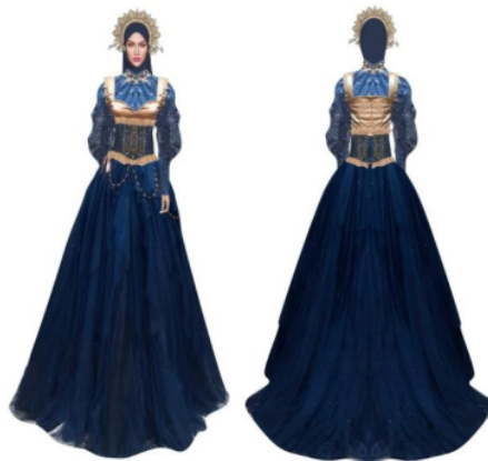
Gambar 1:Desain Busana sta Sumber Ide Reinesance

Pembuatan suatu busana tertentu membutuhkan tahapan pemrosesan mulai dari persiapan,