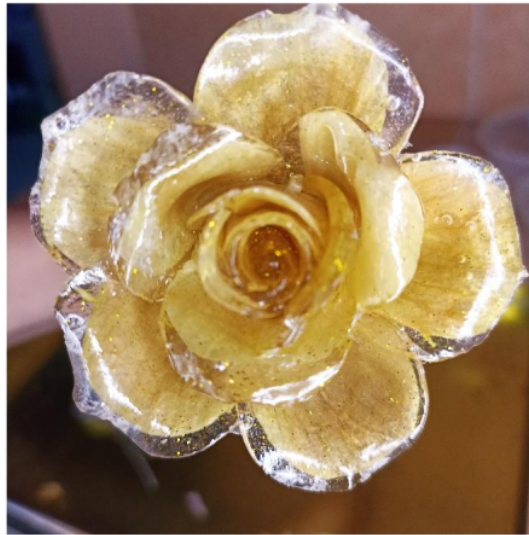
Gambar 6 Produk Hasil Eksperimen 2