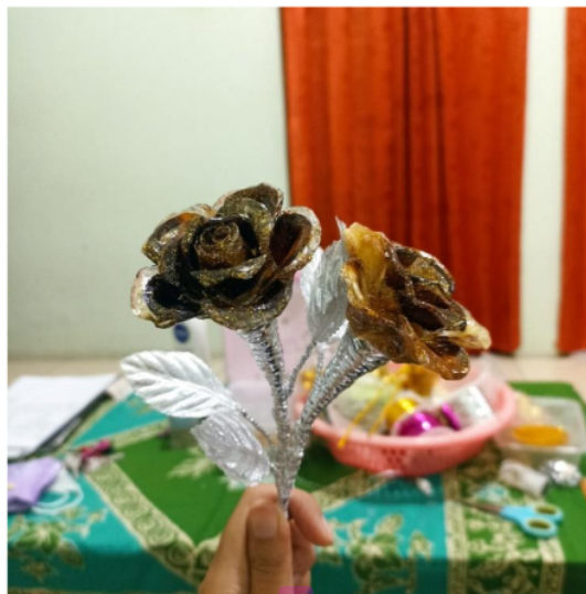
Gambar 5 Produk Hasil Eksperimen 1