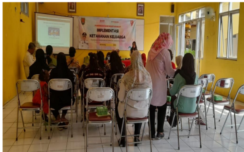
Gambar 2. Antusias Kegiatan Pelatihan

Antusias peserta dalam mengikuti pelatihan terlihat dari keaktifan peserta dalam mengikuti kegiatan pelatihan dari awal sampai akhir. Hal ini tampak antara peserta dengan pelatih kegiatan yang saling merespon positif satu sama lain. Melalui pelatihan Implementasi Ketahanan Keluarga, peserta dapat menambah pengetahuan tentang bagaimana cara menciptakan keharmonisan keluarga dan bermasyarakat melalui Implementasi Ketahanan di dalam kehidupan keluarga dan Masyarakat. Antusias kegiatan pelatihan dapat dilihat pada gambar 2