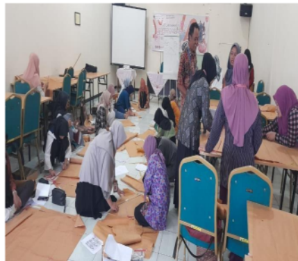
Gambar 2. Kegiatan evaluasi Pola Sesuai Ukuran

Kegiatan pengabdian kepada masyarakat di Balai Pelatihan Koprasi UMKM Provinsi Jawa Tengah, menghasilkan produk berupa busana casual. Antusiasme peserta pelatihan juga dapat dilihat dari keberhasilan peserta dalam mengambil ukuran tubuh. Rata-rata peserta dapat menyelesaikan pembuatan pengambilan ukuran tubuh untuk pembuatan busana casual yang terdiri dari blus dan rok, dengan baik dan sesuai dengan yang dicontohkan oleh narasumber. Dari pelatihan ini peserta mampu membuat busana casual dengan baik, hasil wawancra kepada peserta pelatihan juga menunjukkan pelatihan pembuatan busana casual ini dapat menambah wawasan serta kompetensi siswa terutama untuk bekal dalam mendirikan usaha.