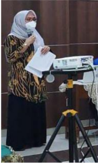
Gambar 3. Pemberian Materi Strategi Pemasaran