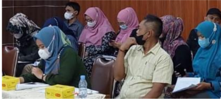
Gambar 4. Peserta Antusias Menyimak Materi