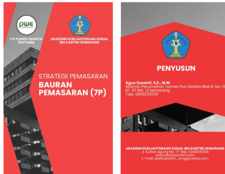
Gambar 2. Materi Strategi Pemasaran

Tahap akhir kegiatan yaitu evaluasi kegiatan. Hasil evaluasi kegiatan menunjukkan jika pelaksanaan kegiatan berjalan sesuai dengan tahapan yang direncanakan. Adapun tujuan dari kegiatan adalah: Memberikan pemahaman tentang konsep strategi pemasaran, serta mampu menerapkan bauran pemasaran (7P) dalam penjualan air minum Shan Shan Water, sehingga dapat meningkatkan penjualan CV Pandu Wisata Edutama. Manfaat kegiatan sosialisasi Strategi Pemasaran untuk Peningkatan Penjualan CV Pandu Wisata Edutama adalah bertambahnya ilmu pengetahuan tentang strategi pemasaran, penerapan (7P) agar dapat meningkatkan penjualan.