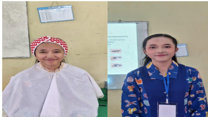
Gambar 4 Hasil Before After tata rias wajah flawess natural

Pada gambar 4 adalah foto sebelum dan hasil tata rias wajah flawess natural.