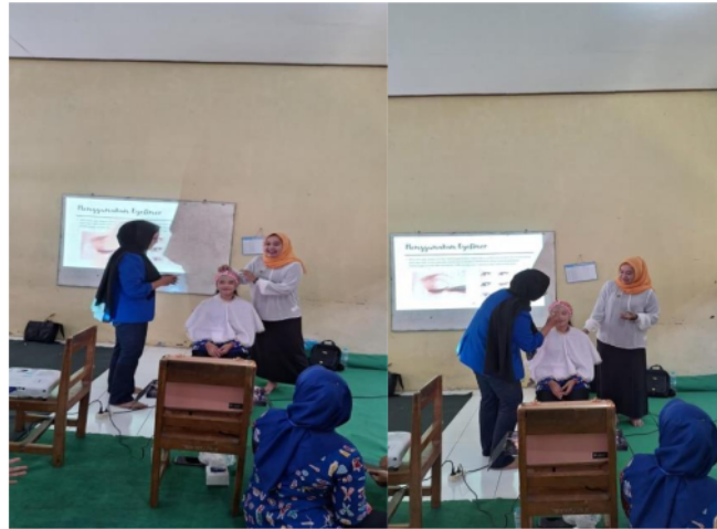
Gambar 3. Proses Demonstrasi makeup flawess natural