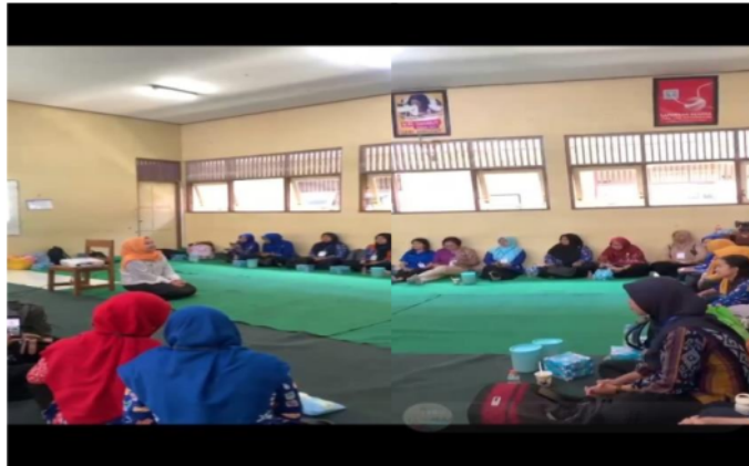
Gambar 2. Persiapan pelatihan

Pada Gambar 2 dan Gambar 3 adalah jalan nya kegiatan yang dilakukan pada saat persiapan dan penyampaian materi secara demonstrasi Tata rias wajah